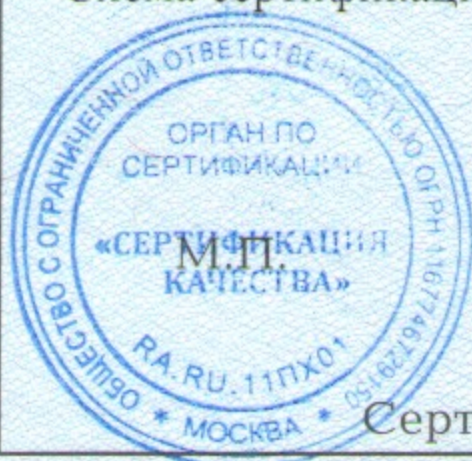
Схема сертификации: №3.